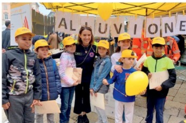
La sindaca Tarasconi fra i bambini presenti alla manifestazione con i cappellini a tema.

● Marciano con i loro palloncini gialli e i cappellini di "Io non rischio", dal Pubblico Passeggio a piazzetta Mercanti, quasi a dire «anche noi siamo pronti a fare la nostra parte»: sono i bambini delle scuole primarie piacentine, anima della mattinata di ieri. Nella prima parte della manifestazione, i volontari della Protezione Civile di Piacenza, insieme all'Asd Piacenza e ai rappresentanti delle forze dell'ordine e dei vigili del fuoco, li hanno accolti per un momento divulgativo, presentato dal giornalista Giorgio Lambri, sulle buone pratiche da attuare in caso di alluvioni, terremoti e terremoti, anche attraverso la visione di video, momenti di gioco e attività ricreative. Dopo aver disegnato, ritagliato e incollato simbolicamente i contorni delle loro manine su un totem raffigurante la faglia di un terremoto, i giovani studenti hanno imparato come preparare il contenuto di un kit di sopravvivenza e visto alcune immagini dell'alluvione che colpì Piacenza nel 2015.