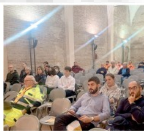
L'elenco ha posto ancora al centro del dibattito le figure dei volontari