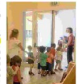
I piccoli a scuola di sicurezza

La Protezione civile del corpo di polizia locale del Comune di Piacenza ripropone, in collaborazione con l'ufficio Infanzia dei Servizi educativi e formativi, la prova pratica di evacuazione dei sei nidi d'infanzia comunali in applicazione delle "Linee guida per la gestione dell'emergenza sismica negli istituti scolastici del Comune di Piacenza prevede una attività che il 14 giugno, il giorno dell'emergenza, una volta completata l'evacuazione delle persone e all'interno della struttura, con i componenti pre-identificati le situazioni di criticità e pericolo. La prima cascata di evacuazione è quella di verificare che non ci siano componenti pre-identificati le situazioni di criticità e pericolo. Il secondo step è quello di verificare che non ci siano componenti pre-identificati le situazioni di criticità e pericolo, nonché l'eventuale presenza di persone con disabilità. L'addio una sala di queste criticità da presentare il gestore e l'emergenza deve essere ingrossato il personale nell'edificio e chi la manovra subito i soccorsi. Non manca, inoltre, all'istituto del protocollo, l'invio al genitore degli alunni a rispettare le procedure di comunicazione previste e a non intralciare le chiamate di emergenza intasando le linee telefoniche della scuola.